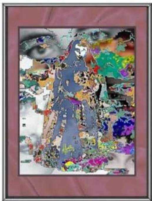
San Juan Caja de color lagos 39x275 cm. Colección del artista